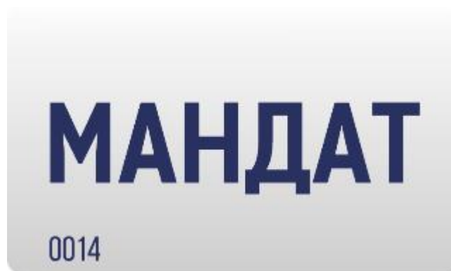
Рис. 5 Лицевая сторона мандата