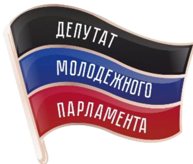
Рис. 4 Нагрудный знак депутата Молодежного Парламента

5.2. Знак имеет булавочное или винтовое крепление. Размер знака 32 х 25 мм.