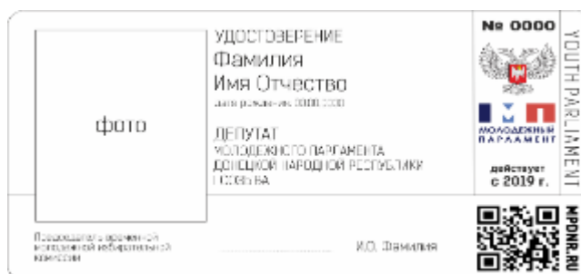
Рис. 2 Правая внутренняя вклейка удостоверения

Фон удостоверения украшен орнаментом, состоящим из синего, голубого и белого цветов.