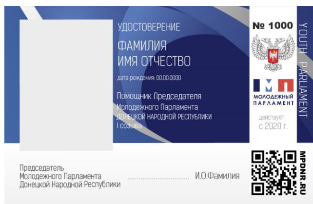
Рис. 2 Правая внутренняя вклейка удостоверения

Фон удостоверение украшен орнаментом, состоящим из синего, голубого серого и белого цветов.